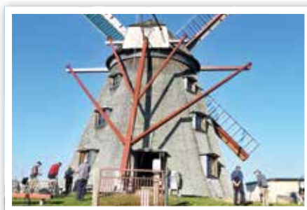
Während des Arbeitseinsatzes an der Greiffenberger Mühle

Um jeden Poller wurde ein kreisförmiges Loch gegraben und zur Begrenzung ein vorgefertigter flacher Betonring eingelegt. Mit der Rührmaschine wurde der Beton gemischt und dann in die