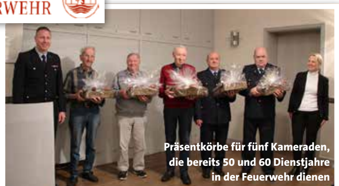
Präsentkörbe für fünf Kameraden, die bereits 50 und 60 Dienstjahre in der Feuerwehr dienen