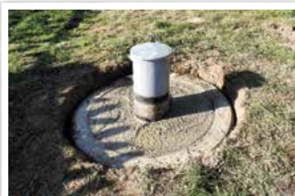
So sahen die Poller nach abgeschlossener Arbeit aus.

Löcher eingefüllt. 44 Säcke á 30 kg wurden für die Befestigung von elf Pollern verarbeitet. Drei Poller müssen noch zu einem späteren Termin einbetoniert werden, denn die Flügel waren während der Arbeiten und beim Aushärten des Betons daran befestigt. Dieser Einsatz war wieder ein Beispiel für das gemeinsame Engagement der Mitglieder beim