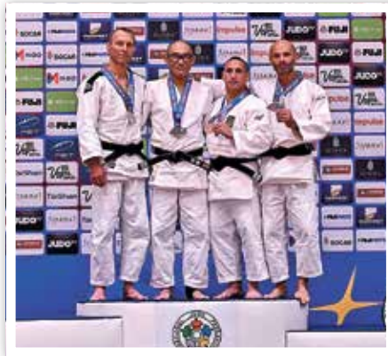
M6 bis 66 Kg