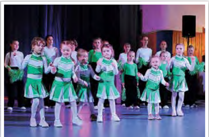
Tanzgruppen des Kerkower SC