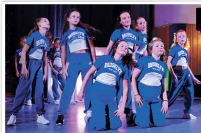
Tänzerinnen der Uckermärkischen Musik- und Kunstschule