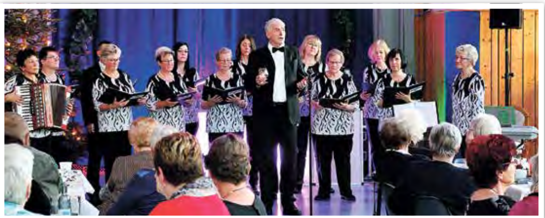
Der Günterberger Chor mit weihnachtlichem Musikprogramm