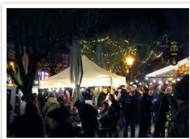
Die Rosenstraße im weihnachtlichen Lichterschein

Grillwürste, für die anderen weihnachtliches Gebäck. Zudem Glühwein, Kaffee, Kakao und andere heiße Getränke im