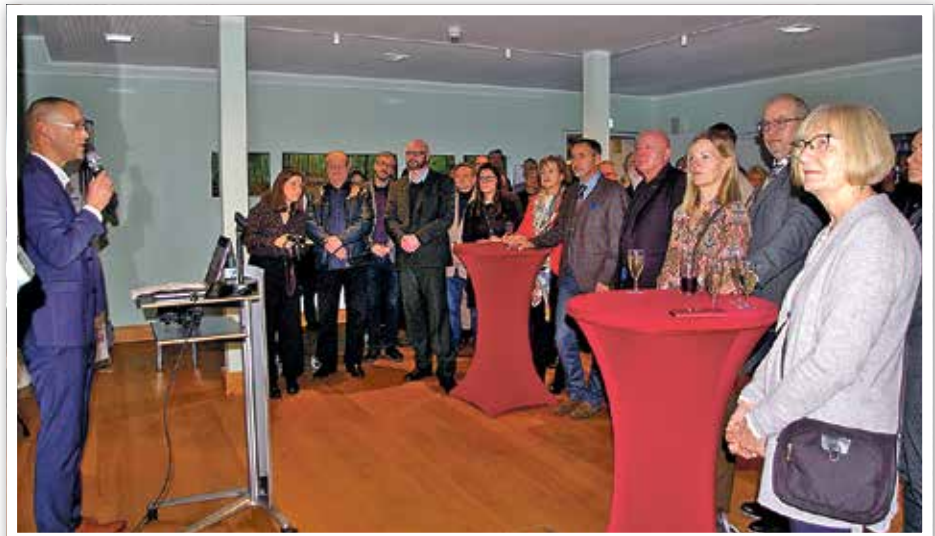
Während der Eröffnung im Haus Uckermark.