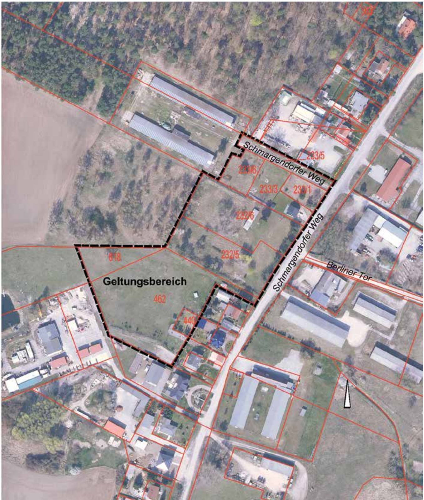
Geltungsbereich, Maßstab 1 : 2.500, Kartengrundlage © GeoBasis-DE/LGB (2019), dl-de/by-2-0