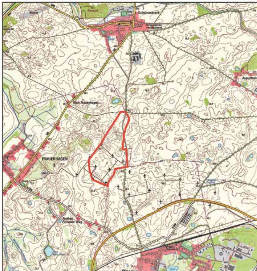
Abb. 1: Übersichtsplan (unmaßstäblich)